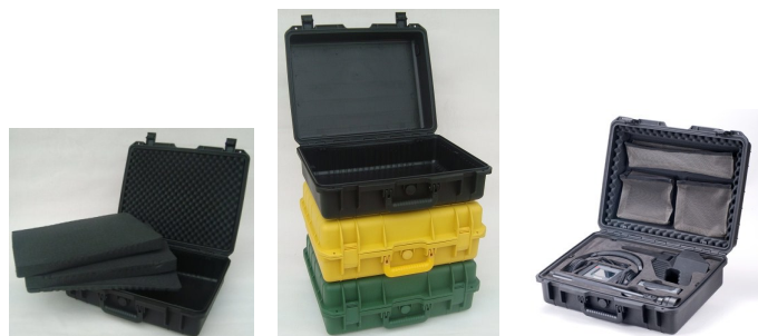
EC61 avec mousses prédécoupées